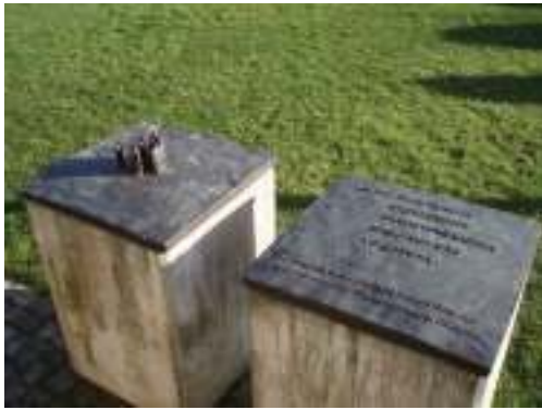
Mahnmal am ehemaligen Gertrudenberg-Café

„Willst Du etwas wissen, so frage einen Erfahrenen und keinen Gelehrten.“