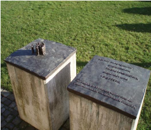
Mahnmal vor der Tagesklinik

„Willst Du etwas wissen, so frage einen Erfahrenen und keinen Gelehrten.“