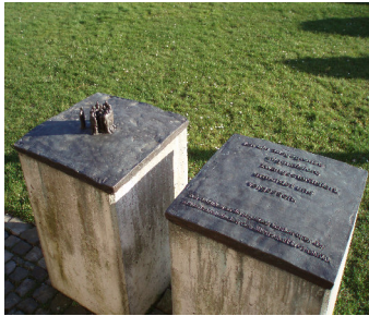
Mahnmal am ehemaligen Gertrudenberg-Café

„Willst Du etwas wissen, so frage einen Erfahrenen und keinen Gelehrten.“